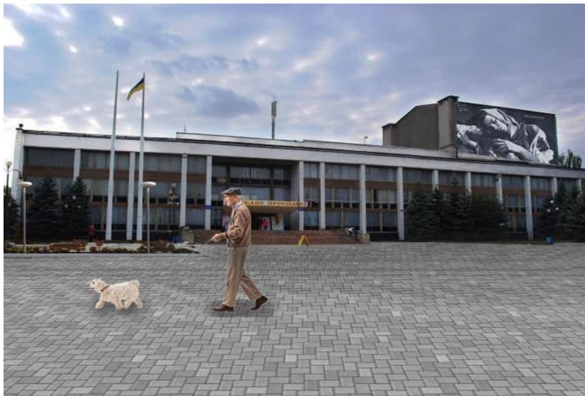
Креативне перетворення міського палацу культури та дозвілля