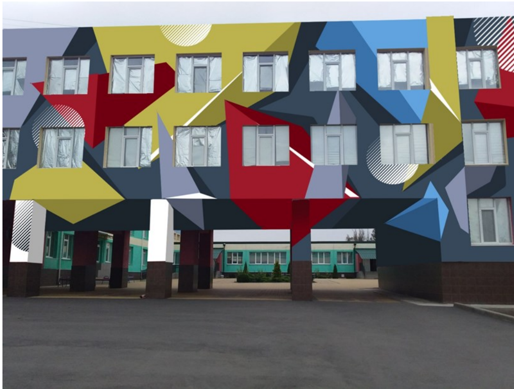
Перетворення загальноосвітньої школи по вулиці Європейська