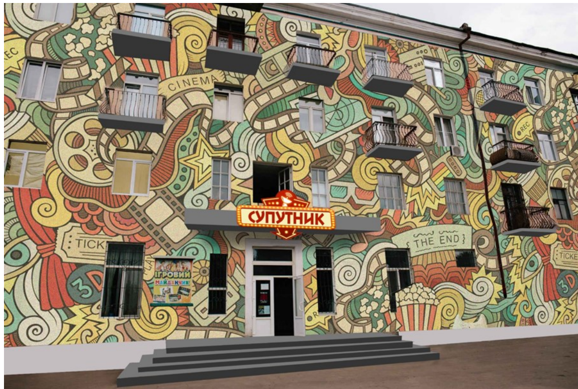
Перетворення кінотеатру «Супутник»