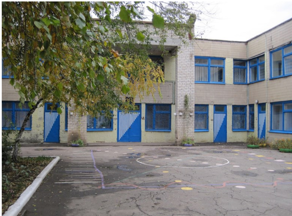
Дитячий садочок №14