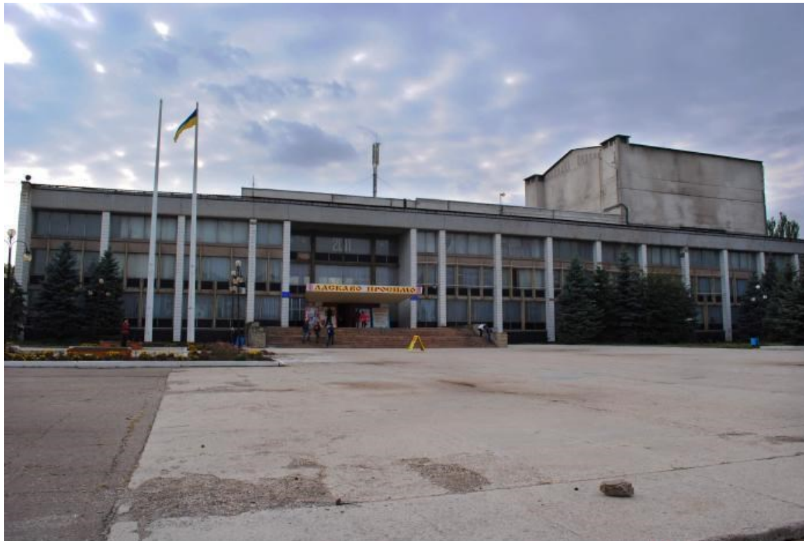
Міський палац культури та дозвілля