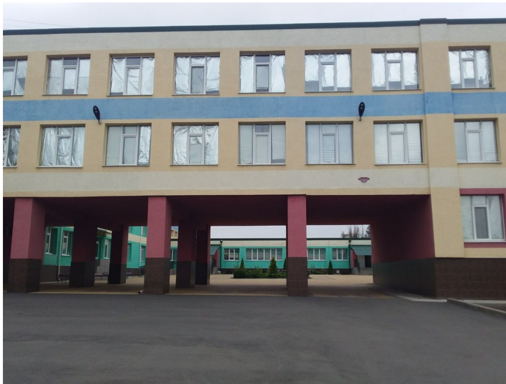
Загальноосвітня школа по вулиці Європейська